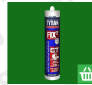
4. ábra Tytan Fix2 GT nagy szilárdságú építési ragasztó Megvásárolható webshopunkban!

A grillsütőt legalább 6 m távolságban kell felállítani a környező fáktól, bokroktól, valamint éghető anyagot tartalmazó építményektől! A biztonságos tűztávolságra használat közben is fokozottan ügyelj, tekintettel a szabadtéri tűzhasználatra!