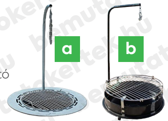
1. ábra: tartozék