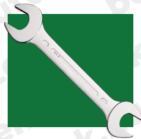
3. ábra villáskulcs